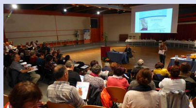
En Dordogne, Vienne et Charente-Maritime, Cassiopea lutte contre la maltraitance des personnes âgées et en situation de handicap

Aquitaine. Ces rendez-vous qui ont réuni des centaines de participants, professionnels et grand public, ont été l'occasion de prendre conscience de la souffrance des victimes, des proches, mais aussi des professionnels face à la maltraitance.