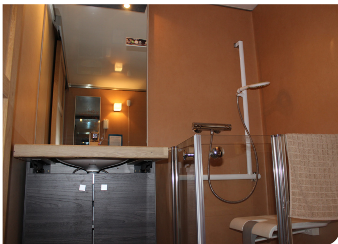
Intérieur du Diamantic, CEP-CICAT (Bas-Rhin).

L'appartement sert également de lieu d'animation lors de journées d'information et accueille d'autres associations de personnes vulnérables, notamment pour des formations aux professionnels et aux aidants familiaux qui reproduisent des situations proches des conditions du réel.